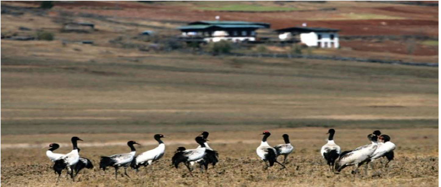
Übernachtung im Gangtey.